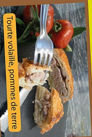
Tourte volaille, pommes de terre

Venez découvrir nos produits dans notre magasin et nos fameuses spécialités !